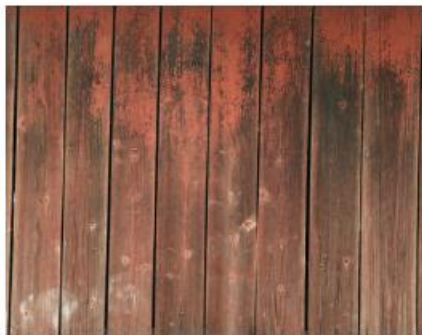
Komposisjonsmaling brytes ned over tid, det anbefales å male opp på nytt når det gamle laget er helt eller delvis nedbrutt.

Per dažnai dažydami namus darote daugiau žalos nei naudos. Dažų sluoksniai tampa per tankūs, todėl paviršius gali tapti neatviri difuzijai. Jei yra bendra taisyklė, ji būtų tokia: nedažykite per dažnai ir dažykite tik tas namo dalis, kurioms to reikia!