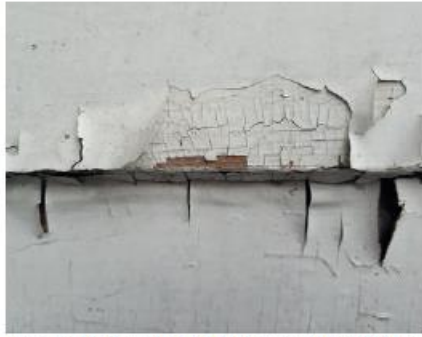
Her ser du tett plastmaling som løsner i store flak over det eldre laget med linoljemaling under. Linoljemaling krakelerer seg ofte slik.